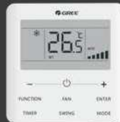
Sterownik standardowy (przewodowy)